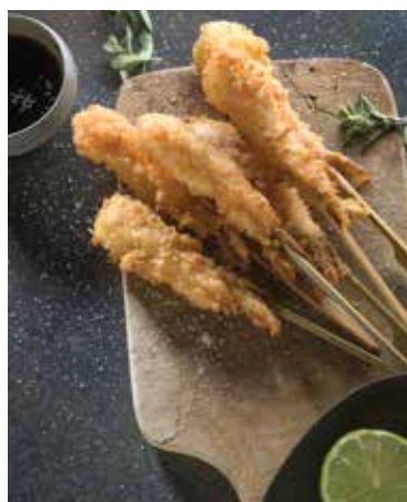
Obalované smažené krevety s LiberoPro Wok