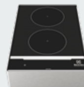
3. LiberoPro indukce dvojitá zóna