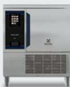
2. SkyLine Chill s Blast Chiller 30 kg