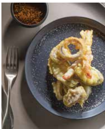
Zeleninová tempura s LiberoPro Wok