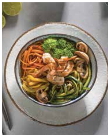
Krevety se zeleninou