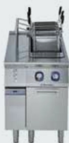
1. XP700 Vařič těstovin