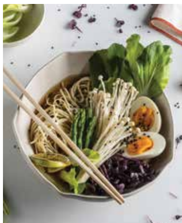
Zeleninová polévka Ramen